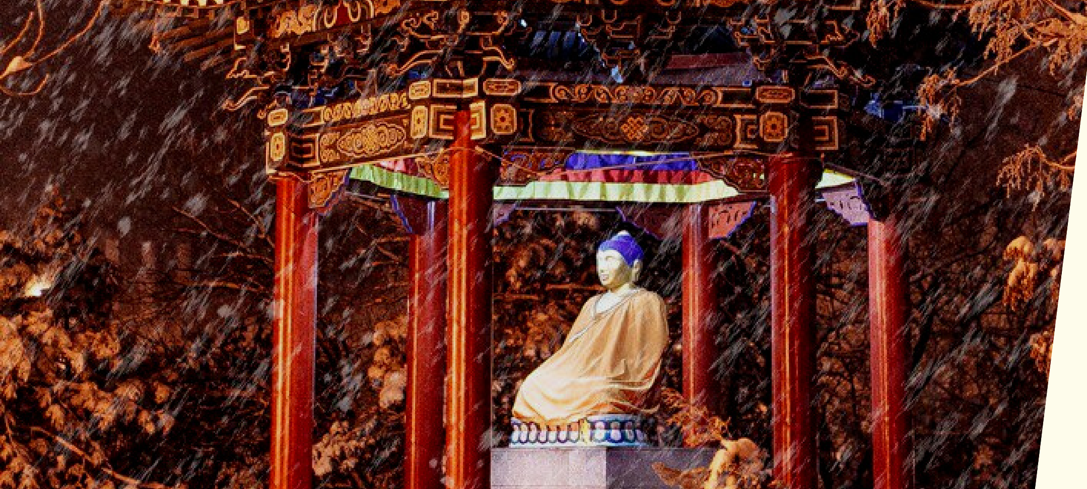
СТАТУА БУДДА ШАКЬЯМУНИ