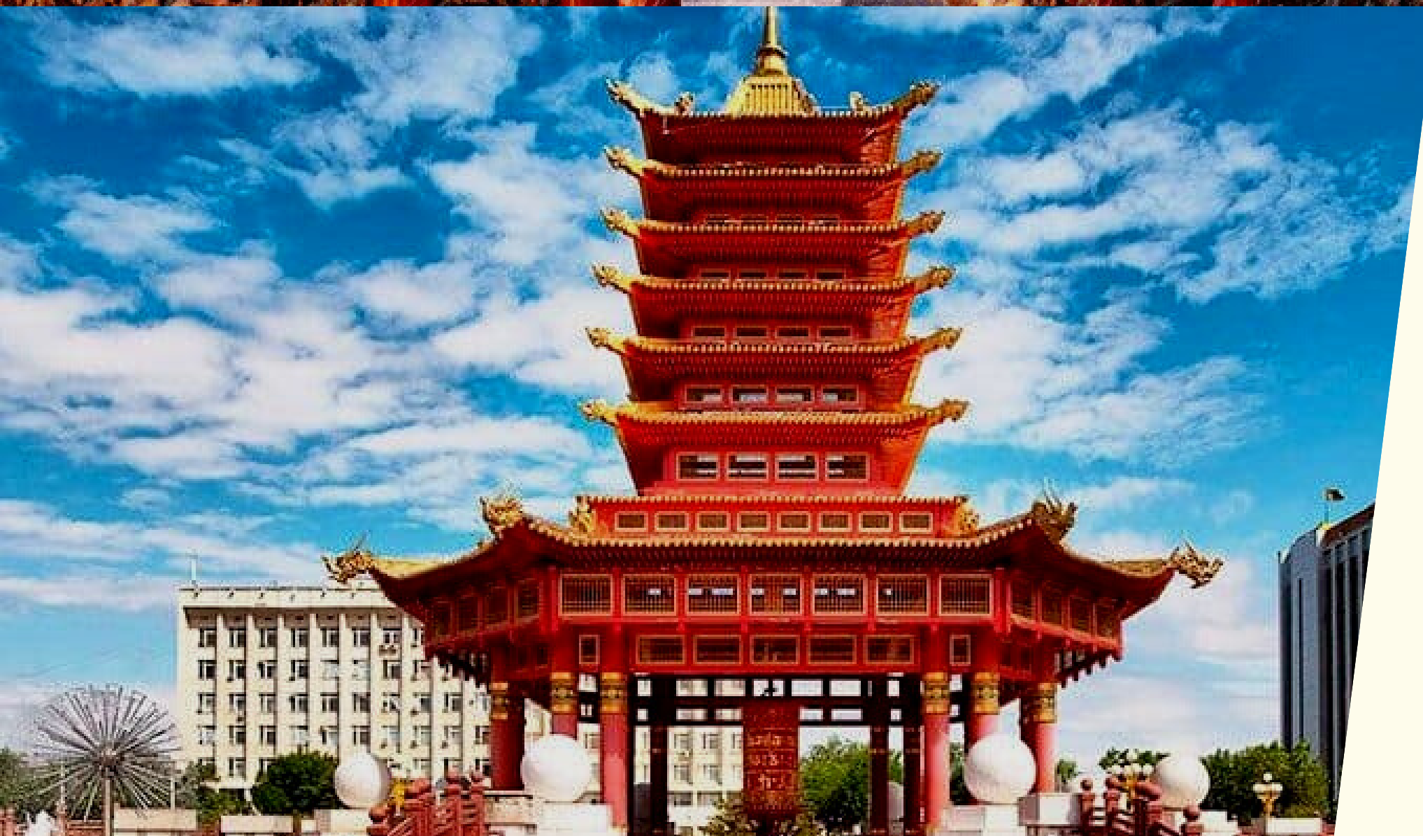
ПАГОДА СЕМИ ДНЕЙ